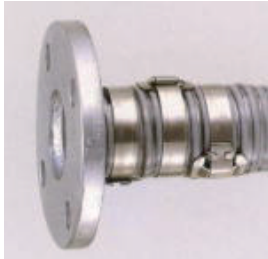
フープバンド締め (JISフランジ付き)