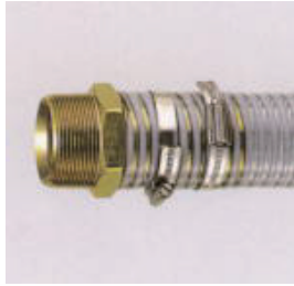
ABAバンド締め (M1金具付き)