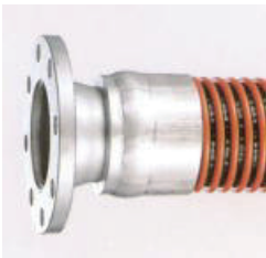
外筒加締 (JISフランジ付き)