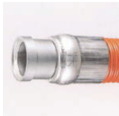
内筒拡大 (専用Sカラー付)