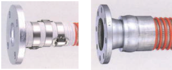
谷埋め・フープバンド締め (JISフランジ付き) 外筒加締 (JISフランジ付き)