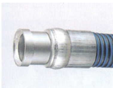
内筒拡大 (Sカラー付)