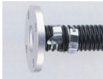
SEバンド締め (JISフランジ付き)【サクション専用】