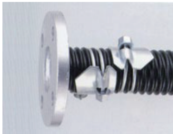
パワーロックバンド締め (JISフランジ付き)